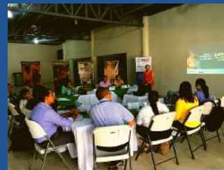
Marcala, La Paz 07 de noviembre 2018