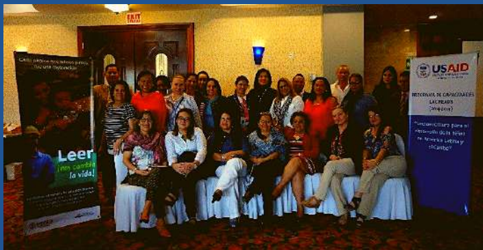
Francisco Morazán, 22 de noviembre 2018