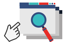
Honduras Recursos de La Campaña de Fomento a la Lectura

Se realizó la socialización de la campaña y sus objetivos, ante autoridades educativas, autoridades municipales, representantes de ONG 's, organizaciones civiles y fuerzas vivas de la comunidad en 7 municipios a través de una jornada de cinco horas en los municipios de: Gracias, en el departamento de Lempira, La Esperanza, Intibucá, Marcala, La Paz, Comayagua, Comayagua, Distrito Central en Francisco Morazán, Danlí, El Paraíso y Choluteca, en el departamento de Choluteca, con una asistencia de 138 participantes y 28 medios de comunicación. Como parte de los productos de las Mesas de Diálogo, se obtuvo 7 Planes de Acción municipal y acuerdos de seguimiento e implementación, en los municipios focalizados.