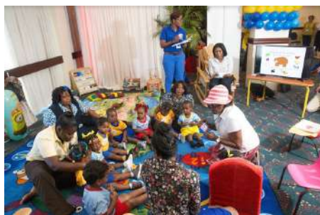
Kiddies Village CHASE Fund y administrada por la Comisión de la Primera Infancia.

Además de la Conferencia, una de las actividades más exitosas fue la innovadora "Kiddies Village" (Vía de los Niños)