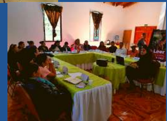
Yamaranguila, Intibucá, 06 de noviembre 2018