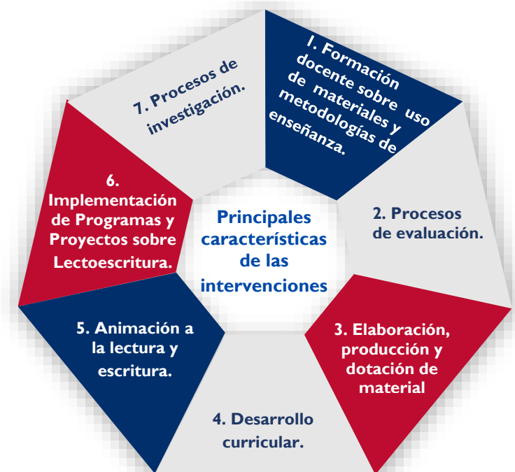
Gráfico 2. Características de las intervenciones de los actores

Los actores identificados han implementado diversas iniciativas para la mejora de la lectoescritura en el país. Las iniciativas se enmarcan en siete ámbitos en particular, como lo demuestra el Gráfico 2: